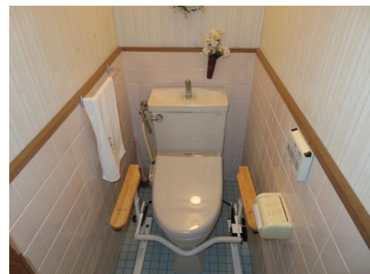
↓ 離れ (室内)